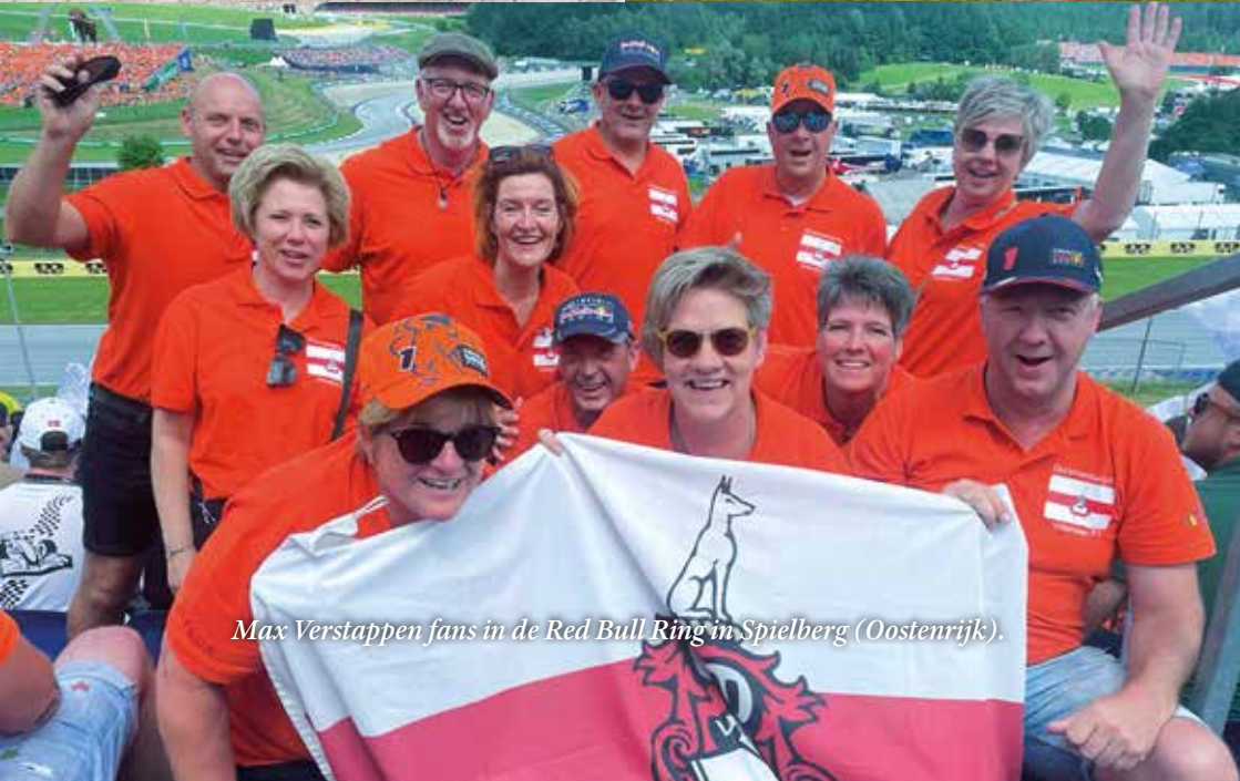
Max Verstappen fans in de Red Bull Ring in Spielberg (Oostenrijk).